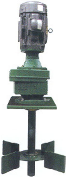
Agitador de lama vertical

Os Agitadores de Lama Derrick melhoram a capacidade de remoção de sólidos significativamente misturando a lama da perfuração continuamente nos tanques de lama. Isto impede que os sólidos se sedimentem e ajuda a assegurar uma mistura uniforme de sólidos e líquidos em todas as peneiras de lama.