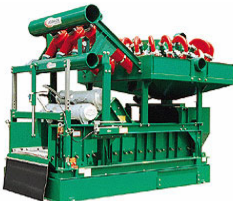
FLC-2000 - 4 Telas com Dessiltador e Desareiator

A FLC 2000 da Derrick é acionada por dois motores de vibração que fornecem uma força vibratória contínua e linear acima de 7,0 G sem precedentes. Constatou-se que este aumento da força G na superfície da tela melhora muito a taxa de transporte de uma peneira, possibilitando a remoção de mais toneladas por hora de refugos.